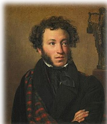
Александр Сергеевич Пушник