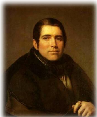
Пётр Александрович Плетнёв

В студенческие годы Ершов сблизился с профессором русской словесности Петром Плетнёвым, познакомился с Василием Жуковским и Александром Пушкиным . На их суд девятнадцатилетний студент отдал своё первое крупное произведение — сказку «Конёк-горбунок», прочитав которую, Пушкин с похвалой сказал начинающему поэту: «Теперь этот род сочинений можно мне и оставить».